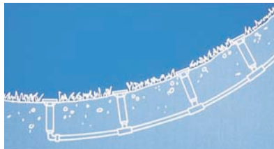
Avec clapet anti-vidange