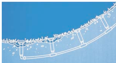
Sans clapet anti-vidange

Le clapet anti-vidange SAM (Seal-A-Matic™) évite le drainage aux points bas